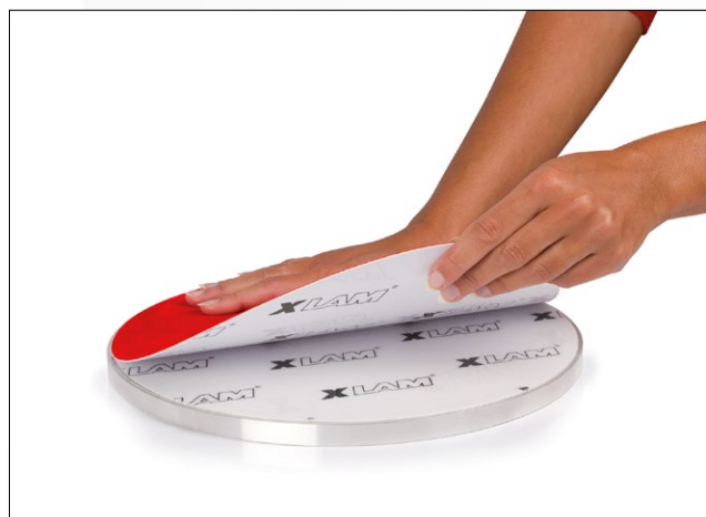
Pose d'un disque série XLAM sur le support XLAM 4.