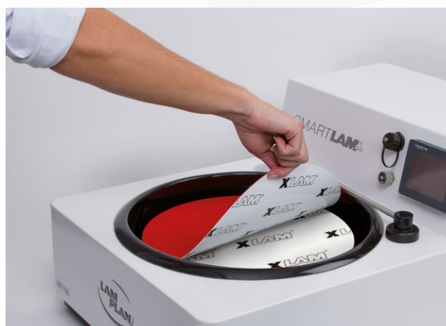
Retrait sans effort du disque de polissage.